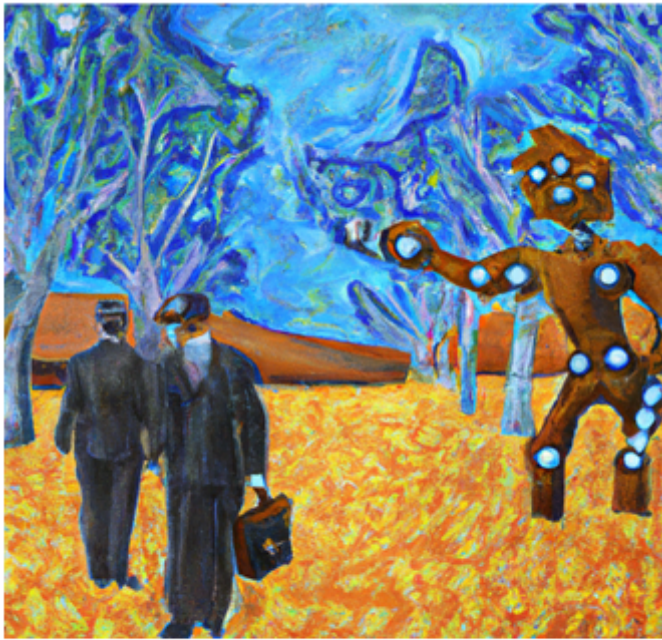
This image used was generated by Dall-E, an AI system that can create realistic images and art from a description in natural language. We asked it to produce a picture of bankers in the future, in the style of Van Gogh.